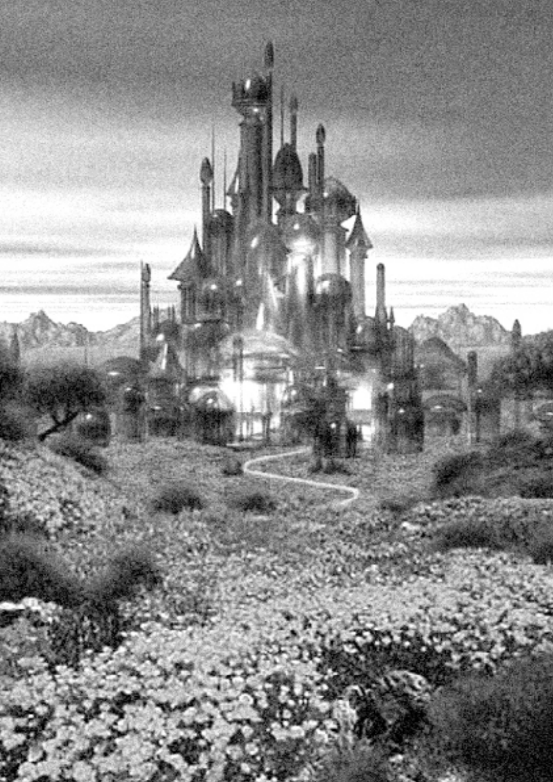
WITCH'S CASTLE, Land of Oz, The Wizard of Oz, Mervyn LeRoy